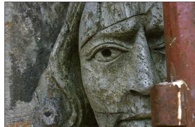
Skulptur på lur. Fra Østfronten.