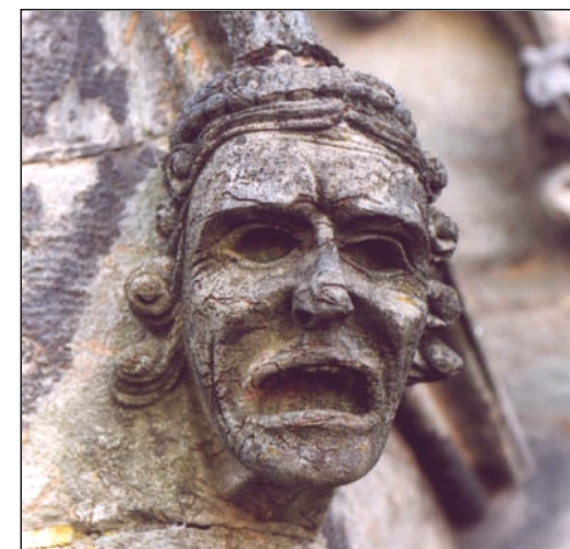
Hoder på koret. Over: Mulig middelald. på S-veggen. Under: Middelald. grotesk på N-veggen