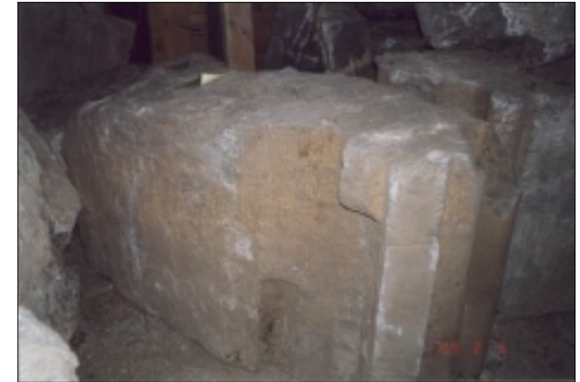
Profilstein fra østfronten lagret i løe på Ullandhaug.

For NDR var det en utfordring å hugge den relativt skifrige kleberen. Også innholdet av karbonatmineraler og det faktum at steintypen generelt er inhomogen (se "Stein på Stavangerkoret" ved å gå til "HJEM"), gjorde huggingen vanskelig i begynnelsen. Etterhvert lærte man imidlertid å mestre steinen og den kom til å bli den mest brukte (i antall objekter hugget) under arbeidet. Dette kan ses på figuren under til høyre.